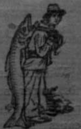
Always get the Emulsion with this mark—the Fishman—the mark of the "Scott" process!

ଶିବର ମୂର୍ତ୍ତିପୁତ୍ର ସ୍ୱଚ୍ଛତାପରାଧକର୍ତ୍ତୃକ୍ତ କର୍ମ ଦେବେ ।