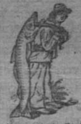
Always get the Emulsion with this mark—the Fishman—the mark of the "Scott's" process!

SCOTT'S EMULSION. ( ସ୍କଟ୍ ଇମ୍ବଲସନ ) ଶରୀର ଗଠକ କାର୍ଯ୍ୟ ସମ୍ପାଦନ କରି ଏକ ଶରୀରର ସ୍ୱାଚ୍ଛତା ସହ ଲିମ୍ବକୁ ଦୃଢ଼ କରି ପାଞ୍ଜାର ଅନୁମୋଦନ ରଖା ତରେ ଏକ ଏହି ପ୍ରକାରରେ ଅପଣ ଫୁଲ ପାଞ୍ଜା ତପ୍ତରୁ ନିର୍ଗତ ଲବ୍ଧ କରିବେ ।